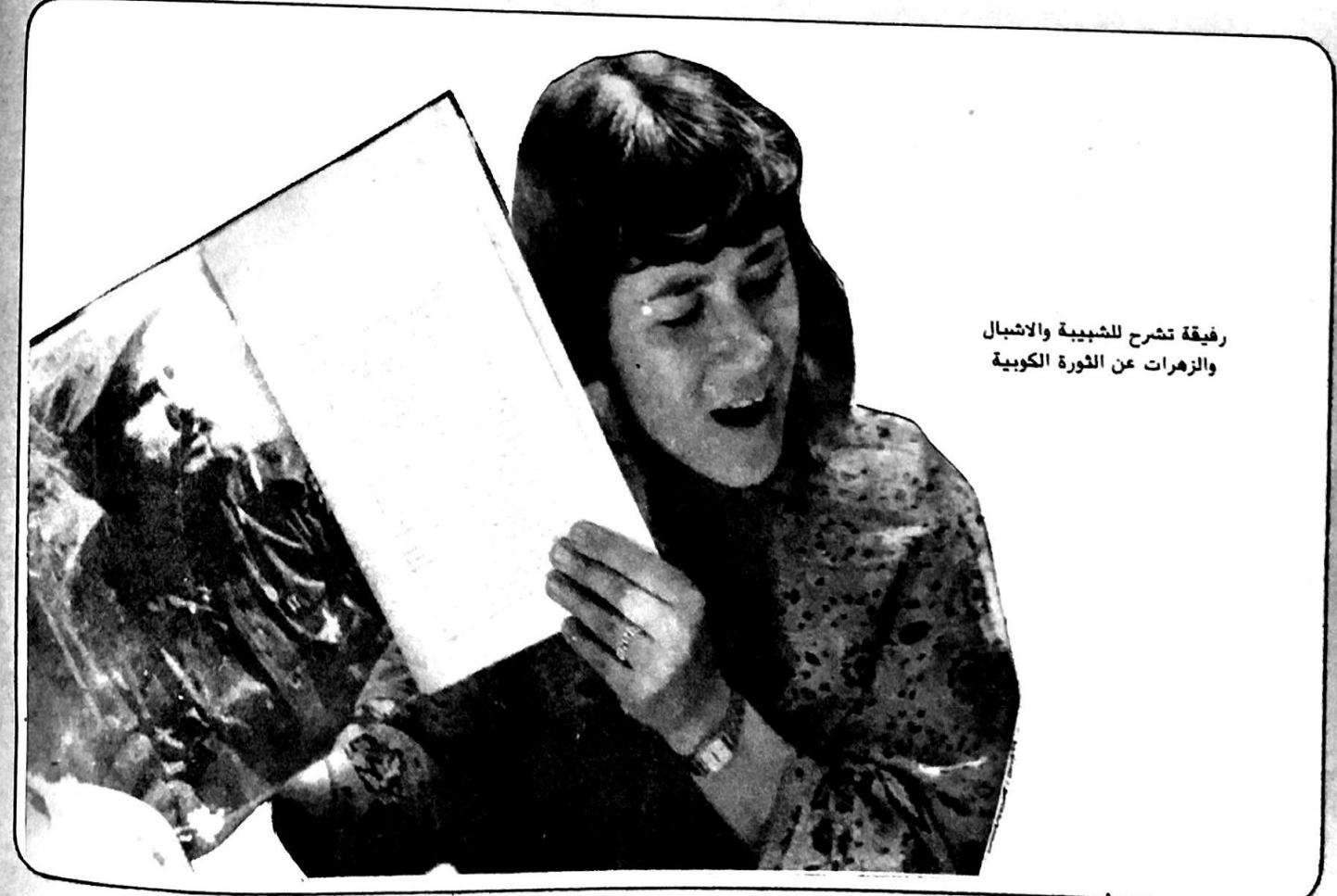
رفيقة تشرح للشبيبة والاشبال والزهرات عن الثورة الكوبية