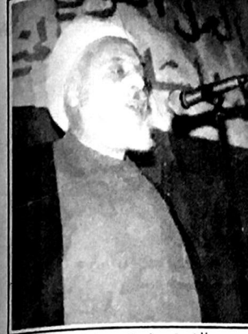
الشيخ سليمان يحقوفي