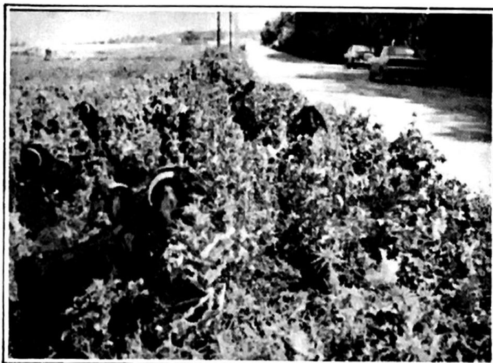
حقول التبغ تحولت الى مراعي

البحث بمصير الريجي وجعلها مؤسسة عامة والسلطة تحاول حصر المزارع الى النهلكة