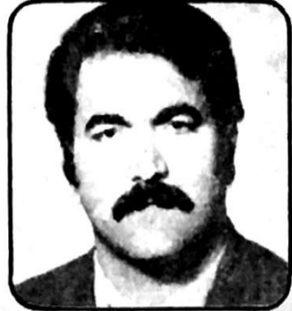
الشهيد شمس الدين الكاظمي