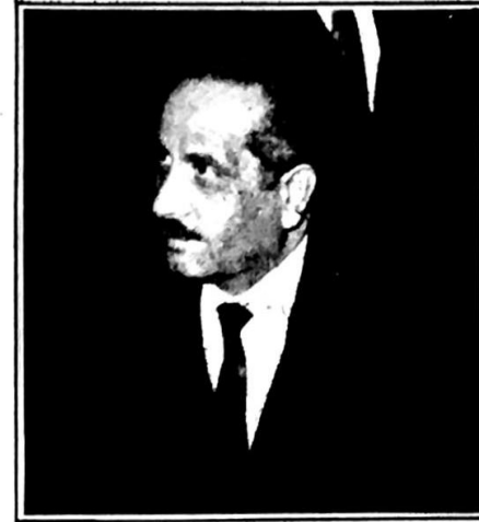
اللوذي : كمبارس المواسم

الملك حسين بعد اعلان قيام المجلس الاستشاري