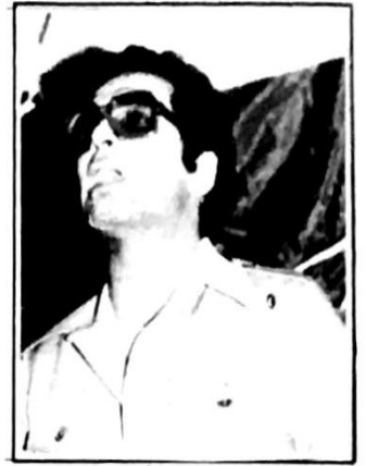
الرفيق بسام ابو شريف