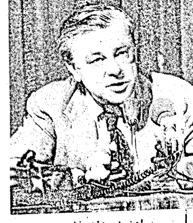
براون : رهان خاسر