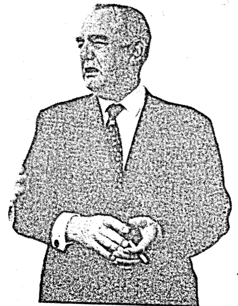
هورستر : الخوف على النفط العربي ..

• برغم ان شيئاً لم يعلن عن اتفاقية عسكرية عقدت بين تل ابيب وبريتوريا ، خلال الزيارة التي قام بها رئيس وزراء جنوب افريقيا العنصرية ، بل وان النفي هو اللفظ الذي اعتمده المسؤولون في كلا العاصمتين الا ان بضعة مؤشرات تدل على ان مسأله التعاون العسكري بين الكيانين العنصريين كانت من أهم المواضيع التي بحثت ، وان لهذا التكتم اسباباً افريقية وعربية .