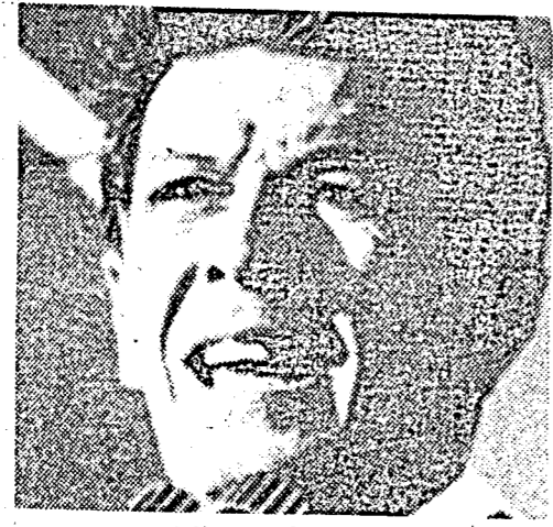
بيرلينغوير : كابوس اليندي

ولكن كل هذا لم يمنح وقوف الولايات المتحدة موقفا معاديا ومعارضاً معارضة كلية لمشروع « التسوية التاريخية » الشيوعي . وقبل بضعة أسابيع وقف هنري كيسنجر ليعلم « عدم قبول » بلاده مشاركة الشيوعيين في الحكم في ايطاليا ، محذرا الحليفات الاوروبيات بان ليبرالية الحزب الشيوعي الإيطالي طارئة ، وانها ليست سوى