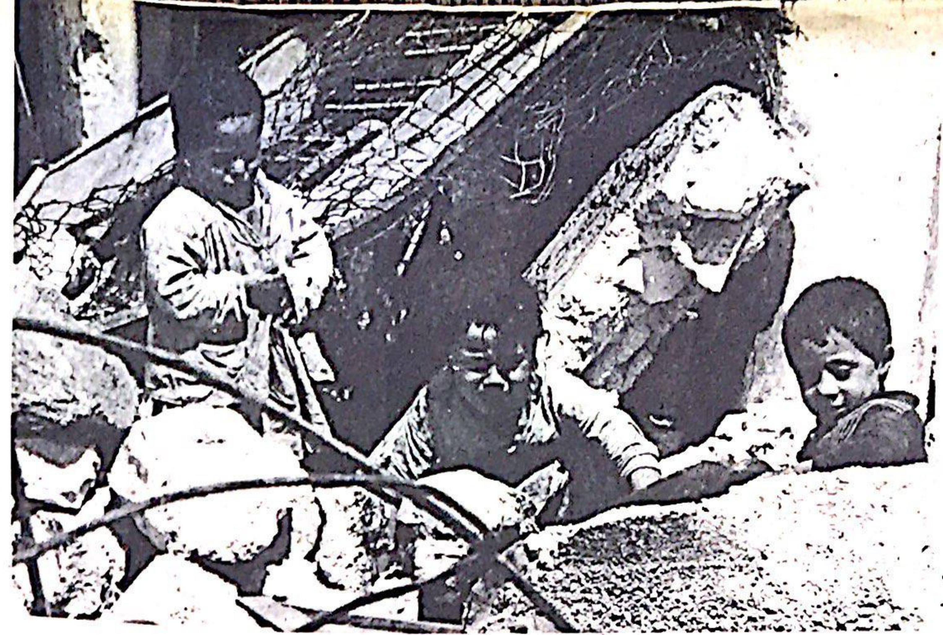
آثار القصف الإسرائيلي في قرية قضاء صور