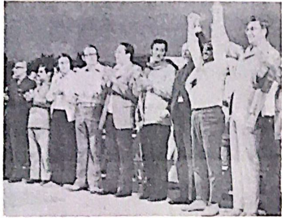
قوة امبريالية في العالم ومرغ انهما في الرباب . عاش نضال شعوب الهند الصينية في كمبوديا ولاوس . عاشت حركة النضال والتقدم في العالم .

● وحينما الرقابة الى المسكر الاشتراكي وبشكل خاص الاتحاد السوفياتي الصدق لحركات التحرر في العالم ومنها حركة التحرر الوطني العربية . ● واخيرا نشكر ألمانيا الديمقراطية لراحة الجبال لنا لعملية التوضيح والحوار والتعاون للوصول الى سلام عادل وصادقة ، ونصان معادي للامبريالية .