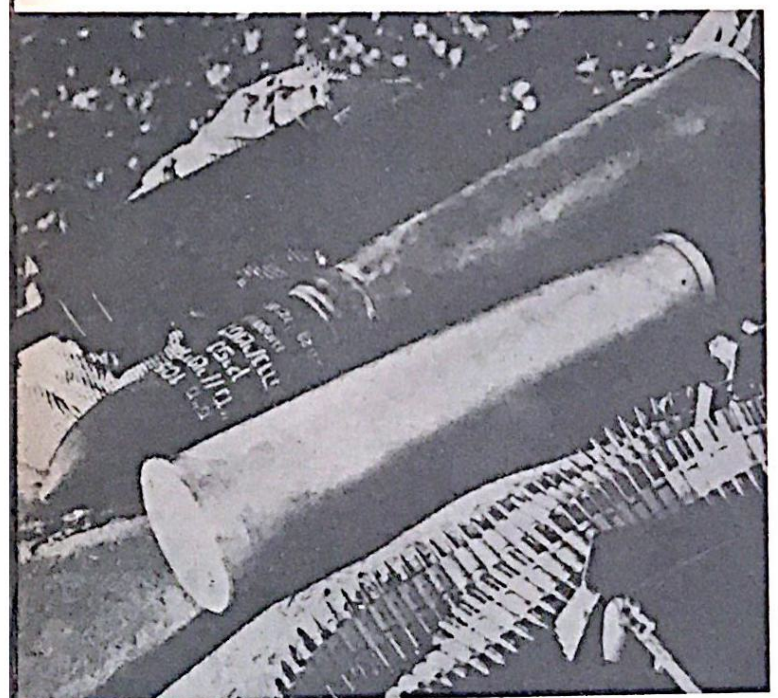
رشاش وذخائر وقذبة وصاروخ بين الاسلحة التي غنمتها سورية في معارك الجولان

تمكنت القوات المصرية في منطقة الحصور الأوسط والدرلسوار من تكبيد العدو خسائر فادحة في المعدات والافراد بينها ٨٥ دبابة و ٥٦ عربية مجنزرة واسر اطقم كاملة من الفراد بعض دبابات العدو واسقاط ١٥ طائرة . وبدا تصبح خسائر العدو في معركة الدبابات بسيناء ١٢١