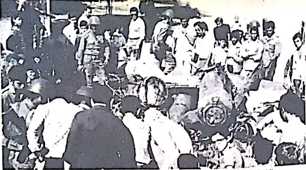
الفراد الجيش والشعب جنبا الى جنب يتفحصون باهتمام حطام الطائرات الإسرائيلية التي عرخت في سوارع دمشق