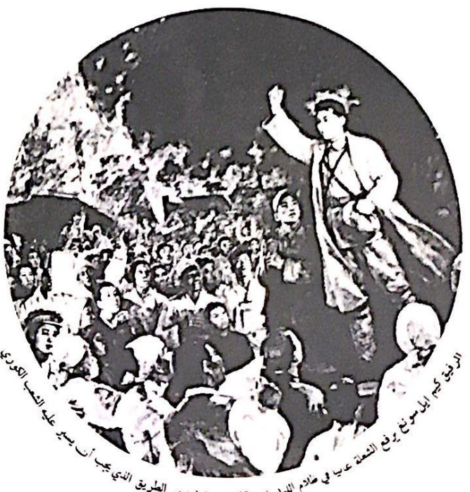
الريف في بوتشينو يرفع العلم عاليا في عظام الليل في بوتشينو، فينيزيا الطريق الذي يجيب أن يعبر عليه الشعب الكوري

وفي المؤتمر بونفانت ايضا مشكلة اغارة تنظيم الجيش الكوري للشعب الكوري وقد كان الفراق الرفيق كيم ايل سونغ بهذا الشأن ، وهو الافراج الذي نصح على الاسهام في الثورة العالمه بواسطة النام بالثورة الكورية بصوره ناجحه ، وهو الموقف الذي نطلق من صيدا « جونغ » قد تم افراجه بالاجماع وحرارة من جانب المبرمجين في المؤتمر .