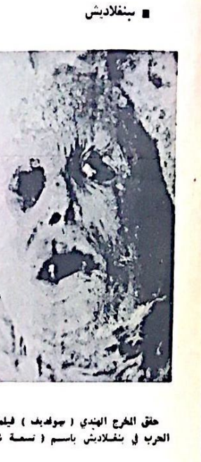
حلقة المخرج الهندي ( سوهرايف ) فيلما عن الحرب في بنغلاديش باسم ( نسمة شعور

ولكن ان نسمع اصوات الرصاص على لون اسود فذلك يعني - كما الهمة - اندلاع الثورة في افريقيا السوداء . امياي - الذي كنه المخرج - اسهدف من ضمن تساؤل الاحداث عرض المساليد الاجتماعية ، وانعكاسها على الحياة .. نقصد الوضع الديني والعلق المصري مغوى غير موجوده .. جوف شجره كبره نخر الحيوانات وعلق فيها كترامين لالهة لافساد النسوة من العقل . اسلام شبه نام الاوازم . يقول البعض ان المخرج لم يزل ينظر برؤية غير علمية للواقع للواقع وبشكل خاص هذا العلم، ولكن مع حسي بان في الموضوع غنى سينمائي يحتمل نوعا اذيعق ، وامكانية سينمائية اكثر مما قدم، ولكن كان في عرض الاحداث اذاه واضحة وقد لتسليبه الوفاء، ودعوة ضمعية للتحرك للثورة.