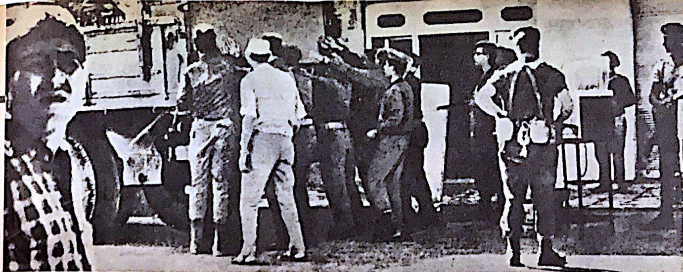
مخططات الترحيل .. فاشلة !