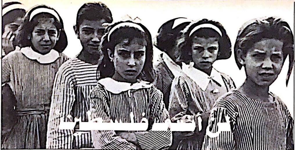
من ( طوفان ) لمتير أبو ديس