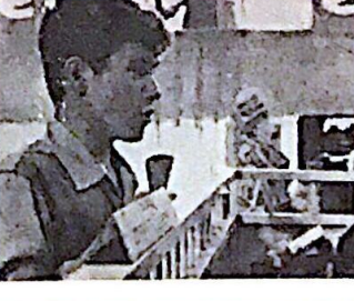
لطفه من ( صيف ٤٢ )

وبناء على تقديره في ملحق النهار بثلاث علامات ( جيد جدا ) - « * * * » - شاهدت فلم - صيف ٤٢ - وخرجت بنتيجة ان الفلم الا من فلم وسط .. فلم يعتمد الاتارة الرخيصة في موضوعه ضمن شكل استهلك قبل اكثر من عشر سنين ، ويتطوي ايضا على كتف من المشاهد المتقلبة بدءا من مشهد العبيدية وانتهاه بمشهد الحنان الجنسي ! ما كتبه ( نصري ) اوجد عندي شيئا من الهيئة لتفسير الاحداث ومراقبة وايضا للمشاهد التشار إليها في النقد ، وكان ذلك