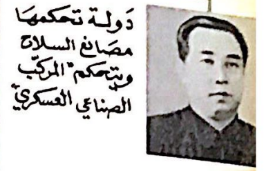
دولة تحكمها مصانع السلاح ويتحكم المركب الصناعي العسكري