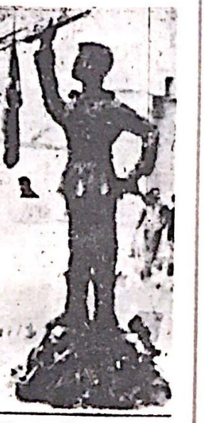
« محارب مصري » نقال صنمه سكان القتال من شطآن القنال ورمادها

انت الذي خربت . واشتد بينهم الضحك والدخول ، ولم طبت غمة سوداء كشفت ان اشتربت عليهما ، فانصرف واحدهما عن الآخر .