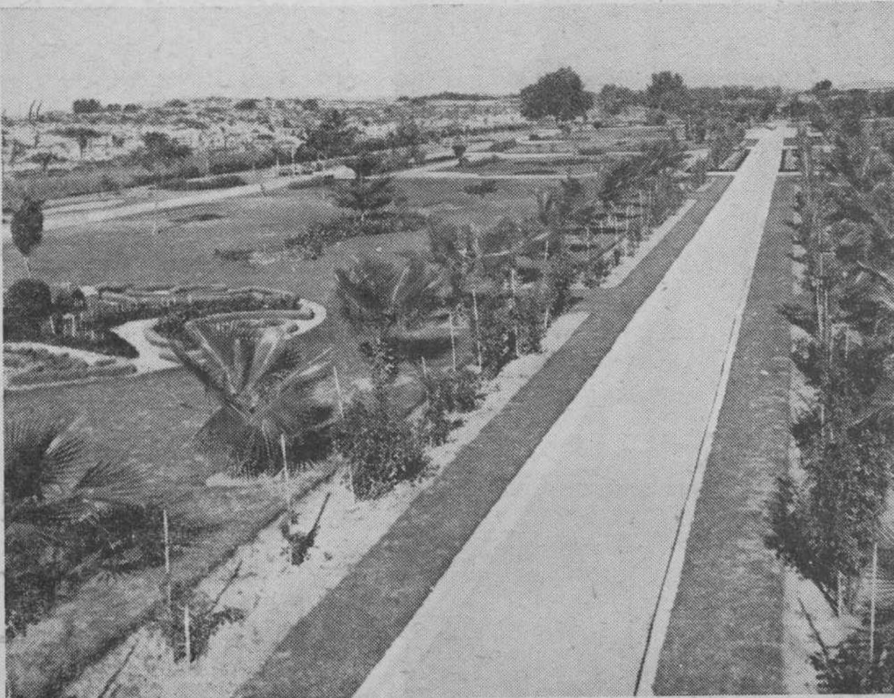
حديقة بلدية غزة الجميلة وهي احسن مثل على تقدم المدينة

حضرة الوطنى الكبير بشير بك السعداوي رئيس الجمعية الطرابلسية البرقاوية في دمشق المحترم: