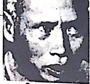
عام فان دونغ

«فإذا فرر مئات الألوف من الناس الووفو ضد الحكومة، رغم الاجراءات البوليسية فذلك لانهم وعوا بان نصرا شيء حقيقي. ان المسؤولين كات هذه الدراسات اساسا استراتيجيستا عسكرية والسياسية، وولفونقا الدبلوماسية في السنوات الاخيرة. وكانت بالاتي خططنا لحرب طرفة الاجل، وفتننا بالتضلل الشعبي.