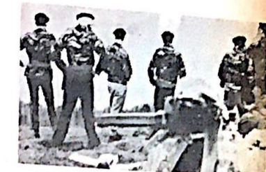
مقاتلون من الباسك في مركز للتدريب