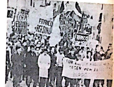
في المظاهرات الأوروبية التأييد للباسك