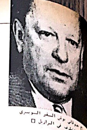
جورجس بوش السفير السويدي المخطوف في البرازيل

كانت العملية السريّة السويدي في البرازيل في الاسبوع الماضي ، وان الا انها تكسب اهمه خاصة في هذا الوقت بالذات ، تميزها عن العمليات السلطانية البرازيلية في اعطاء الانطباع بانها بانت العملية بعد ان نجحت البلاد ، وخاصة بعد ان تمكنت في ظرف ستة واحد من بضعة القائدين الثوريين كاراوس ميرينيللا وبواكم كامارا فرييرا .