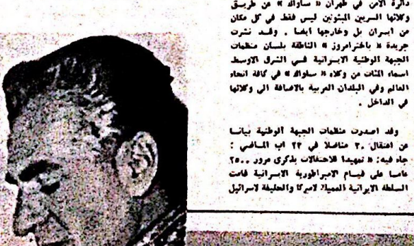
وقد اصدرت منظمات الجبهة الوطنية بياناً من اعتقال ٣٠ متصلا في ٢٢ اب الماضي : ٢٥٠٠ جزء فيه : « نهيما لاحتفالات بذكرى مرور ٢٥٠٠ عاما على قيام الامبراطورية الراهبية قامت السلطة الراهبية العميلة اميركا والحليفة لاسرائيل

ونضوي رجال الخبرات في نظام المعاملة الشاهنشاهية والمهنيين على ايدي المفاسرات الاميركية وديوات التجسس في عهد السنو ، ينسجون بشكل رهيب بين اسنة الشعب معين كل لغة ، يعطون شكل لغتي كل من يتكلم بان له لافة بالناصر الوقيبه من قريب او بعيد . وتعود هذه الحملة الراهبية الكترسة دائرة الامن في طهران « سواره » من طريق ولائها السريين المبتون ليس فقط في كل مكان من اسيران بل وخارجها ايضا . وقد نشرت جريدة « باختراموز » الناطقة لسان مخفات الجبهة الوطنية الراهبية في الشرق الاوسط اسماء الثلاث من وكلاء « سواره » في كافة انحاء العالم وفي البلدان الغربية بالإضافة إلى وكلاء في الصاغل .