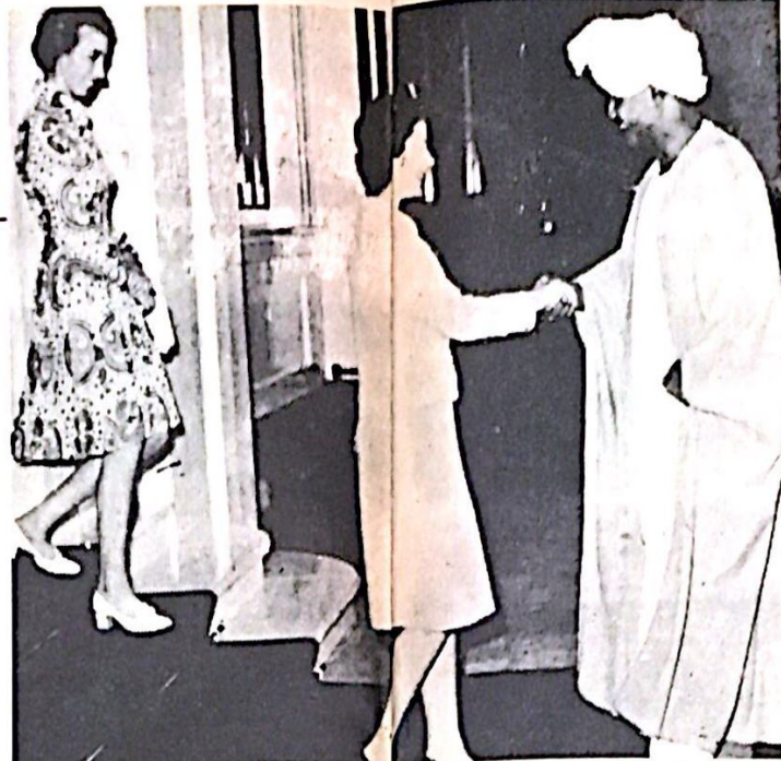
الرئيس السوداني النمري لسدي اهناعه مع الملكة اليزابث في قصر باكنغهام بلندن ويبدو اليميره ان ابيه الملكه

وقد كان توقيع اتفاقية ادبي انا بين الرئيس النمري وبين قادة الانحاصليين، بداية التحول الحاد في نظام الحكم السوداني، وعودته إلى الإرجاء في احضان الاستعمار والقوى الامبريالية. فقد مضت الخرطوم بعد علاقاتها الدبلوماسية مع المنا الغربية، على كات قد