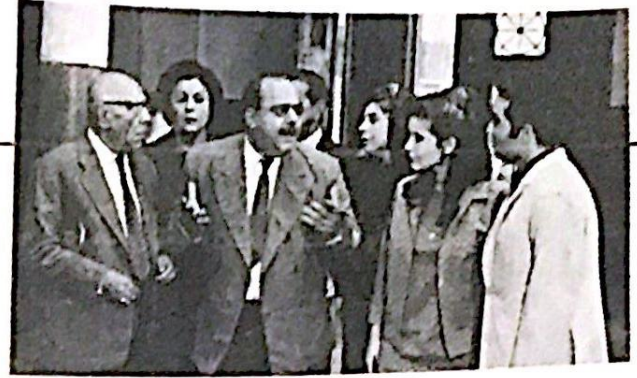
تفحصت فيانم قضية ٦٨