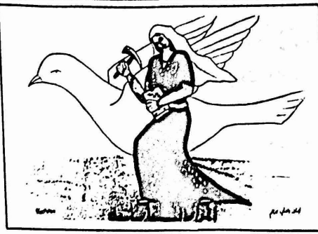
رسم: عدنان الزبيدي تطوير: نجلاء بندلي بروم

من جهة اخرى، تتزايد شكاوى الطلاب، من التدخل في شؤونهم مثل تقييد حرية الحركة لمجلس الطلاب، واتباع اساليب لا ديمقراطية في انتخابات المجلس، نعمت عنها عدم المشاركة الفعلية من الطلاب في انتخاب مجلسهم، ومنها منع الاجتماعات الطلابية الا باذن من الادارة واغلاق البوابات امام الزوار. الا بعد ابراز موياتهم