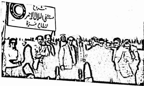
الارض المنوى اقامة المستشفى عليها

عزيزي القاريء .. ان جمعيات الهلال الاحمر الفلسطيني منتشرة في كل مكان في ربوع الوطن العربي، وعلنا اخي القاريء تعطيك لمحة بسيطة عن جمعيتنا في قطاع غزة والتي تحتفل بعيدها السابع في منتصف مارس.. (آذار)