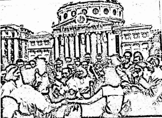
فرقة من المهرجان العالمي الرابع للشباب في بوغراست

وستشارك هذه الفرقة في المهرجان الحادى عشر للشبيبة والطلبة العالمي في كوبا.