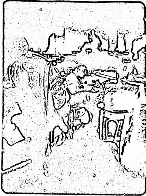
الرفيق الشهيد عبد الخاسق محجوب