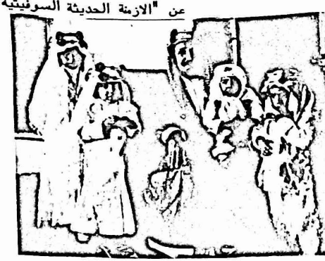
امراء آل سعود مع والدهم

عن "الازمة الحديثة السوفيتية" قبل عشر سنين كان تأثير السعودية في العالم العربي والغرب ضعيفا نسبيا. ولكن بعد ان أصبحت تنتج (400 مليون طن من البترول في السنة وتحتل المكان الثالث بعد الاتحاد السوفيتي واميركا تزايدت قدرتها المالية بدرجة كبيرة (بلغ نجلها سنة 1977 لوحدما 4000 مليون دولار). وتزايد بالتالي تأثيرها.