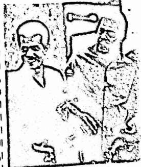
علي ناصر وعبدالفتاح اسماعيل

اجرت مندوبة طريق الشعب، مقابلة صحفية مع علي ناصر رئيس جمهورية اليمن الديمقراطية وفيما يلي نص المقابلة.