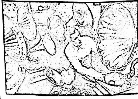
هذه المناسبة قال: "ان الناس لن تغفر لي، انني لغلطت مرة مع انني اصبت الوف المرات!"