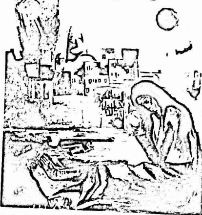
حازبه في عماره لفته رام الله وسلاله العيينون بالنس عن سدر مسروره الابن الذكر