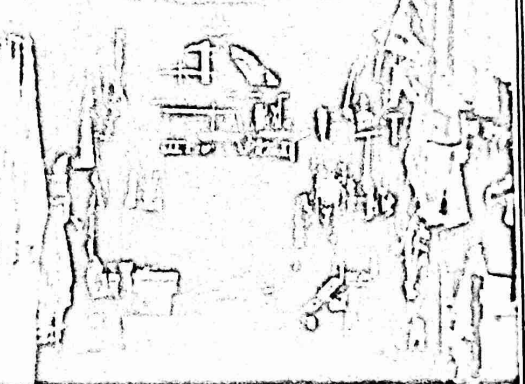
سوق خان الزيت - شارع مغلق