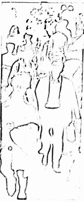
عقبه التكية يتحول الى شارع رئيسي

من ما كان يلحم في يوم من الأيام ان تحول سوق خان الزيت في البلدة القديمة الى شارع فرعي . ومن ما كان يتصور ان سلكا أصحاب المحال التجارية في هذا السوق الرئيسي (سابقا) الى عصبة الوثب للمعمور الكره وبتأوله الرجز . هذه هي الحقيقة وهذا هو الواقع منذ إغلاق مفاضع الشوارع في خان الزيت وعنده القدس وعنده الحامضه ورتسا على ذلك تحول عدد من الشوارع الحامضه (مثل شارع عتمة القديسه) الى شوارع رئيسيه كمنتهه بالعارة وحولت الشوارع الرئيسية الى شوارع جانبية .