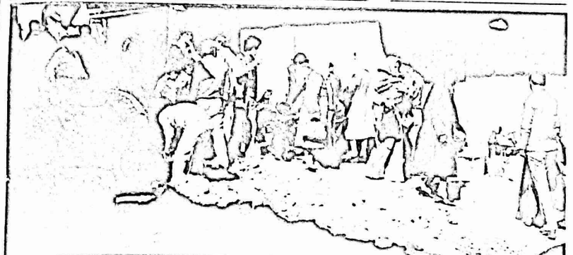
المعانة من الحفريات في باب العمود

الملقى على غاظها . اما بعد فبول الموارجون ان البحرة والرحيل على مر التاريخ تعود لاسباب امكانه وساعد بالدرجه الاولى . والسؤال هنا هل حده هي السنة المقصوده؟؟ ولماذا لا يتم اسنات العكس؟؟؟