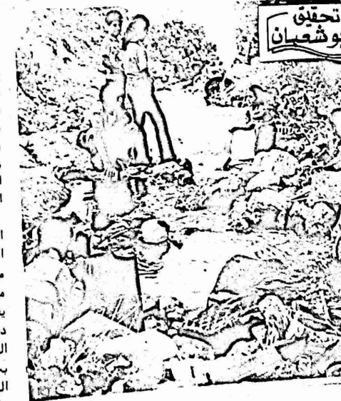
تحقيق ابو شحان

بيوت تعرضت للهدم ان زياده تدفق المياه التي حدثت في الاوبئه الاخيره . والفيضانات . كانت تهدد بيوتا