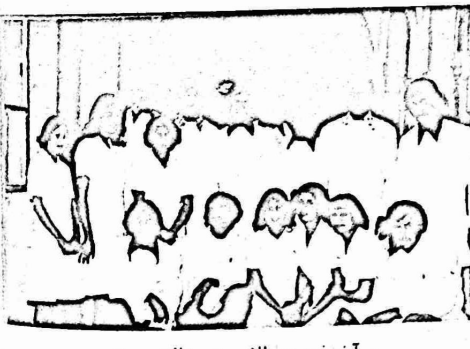
آخر فوج من طلاب مدرسة التمريض

نساء... نساء... نساء... الى كل مؤسساتنا في المناطق المحتلة والوطن العربي والى كل انسان لا يزال قلبه ينبض بالحب والوفاء لهذا الشعب ، نتأكدكم التمدخل القوي والعاجل فورا ، والعمل على منع وقوع هذه الكارثة ، ونحن لا يساورنا ادنى شك في وطنية مؤسساتنا ، ولكن آن الاوان للانتقال الى ميدان العمل حتى نثبت اخلاصنا لهذا الشعب . مجلس طلبة التمريض في المطلاع