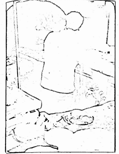
رغيف نابلسي ، رغيف قريني ، رغيف رام الله

اغلاق المخازير العربية ، وحتى لا يدفع المواطن وبالدرجة الاولى ذو الدخل المحدود ، ثمنا لنفس وزن الخبز الصباع ، فانه اصعب من الضروري العمل على اثناء حسيات تعاونية تضم اكر عدد من المخازير العربية ، والعمل على ايجاد رقابة شمعية تقوم بها المؤسسات الوطنية فليس حل مشكلة المخازير الزرسة مفروض على المواطن ، بل ان تشكيل مثل هذه الجمعيات التعاونية هو الطريق للتصدي للظلمة والمضايقات من قبل السلطات ، وبالتالي لحماية المواطن وتوفر رغيف الخبز لعائلته واطفاله ، ومع كل هذا يبقى الحل الايثل والذي لا يدبل له على المدى السمد وهو وجود دولة فلسطينية مستقلة ، ترعى