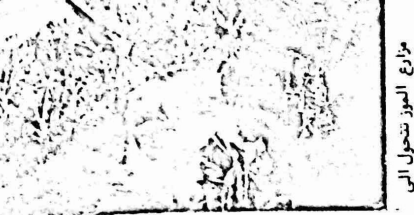
مزارع الموز تتحول الى

خسارتي : ٢٠٠ دونم خضروات ، ١٠٠ دونم موز ، بركة مساحتها ١٠ دونات ، بالإضافة الى اراضي الحبوب ، دخلي المستوى كان ٢٠ الف دينار اردني .