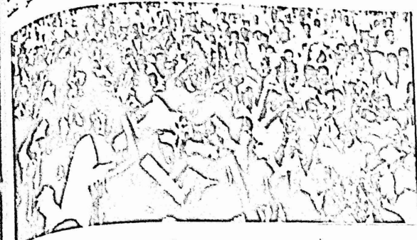
شعب السودان في مظاهرة

واضعة شطت النبات من صهيون الشعب وباده الغابات عمنا الرعايي . محمات سد الصالح سعودي دراج وعمن اعنة الموكريه للحرب السوعوي سلطانه حامد وحليل السويبي والعزوي ان فوات الات السويبي الى استخراج الوثائق المنسفة من دهبه للشمس على السهمه سني الذي سويبي في طارت السويبي ان نفسا سلطام في قدرات حياض