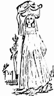
بريمه وساط .. فوصت لها على السلال ، وكوب التراب فوق حذور الريمون ثم زرعت سلسلي الريمون والليمون اللتان اشترينهما

ملفوا منها ، فكسروا ما كانوا بذعورنا بالحبوسه ... - ... ما ملكون ابوكم .. واحد يتول الناس .. ماى اندال وفي الحفل .. بحركت ام محمود بالناس . وكان يومها حافل بالعمل .. الامل .. الحب السابق .. ورائحه الارض الجميله .. حب وظاه ذلك كله ودعت حطبا .. اسماها بل قلبها الاخر .. السابق بالحصاه ورجعت للبيت وهي تحدث نفسها . - بكره بنكر الشجره .. وسفند نحبنا انا والاولاد . وشاك في الجانب الاخر ، كان بعض العمال راجس بحدنون المسهم : - بكره بنخلص اللورته وسفنى عنما صاحبها . صدفيا الحمله .. انهم يعرفون ذلك .. ولكن لعادا بواصولن المعمل ؟؟ . وحارت بين الواقع والواجب وعرفت ان هناك خيارين احلاها مر وبدت سراوح .. ندمت على نفسها ولامتها .. لقد ظلمتهم لا .. اذن ظلمعلوا .. على الامل بنظ نتوقهم بنينا .. على الامل ■