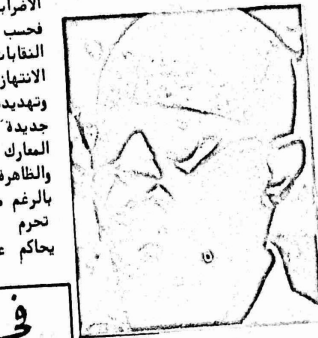
عبد الخالق محجوب سكرتير العام للحزب الشيوعي السوداني اعده النميري قبل ثمانى سنوات

المودانية ، يعاني من اضطرابات خطيرة في صحته . وقد كشف النقاب مؤخرا عن ان امين اصبح مشلولاً تماما بسبب جلطة دموية في دماغه نتيجة للمضايقات القاسية التي تعرض لها في السجن . ذكرت مصادر سودانية مطلعة ان المعتقل السياسي في الخرطوم قاسم امين ، وهو عضو المكتب السياسي للحزب الشيوعي السوداني وشريك الشفيع احمد الشيخ في تاسيس الحركة النقابية