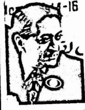
١٦- المؤتمر الكعبر وود ممثل ثوب حوالي ١٣٠ دولة ، جددوا اسباب رمس شاندرنا رنشا لمجلس السلام العالمي . ومثل الشعب العربي الفلسطيني في مؤتمر صوفنا ماسر عرفات رئيس اللجنة الممقعدة لمنظمة التحرير

ان من حق ثون ان يقول ما يشاء فلم يكن ممسا في يوم من الأيام " مدفلا " على مصادره اوروبية حتى يفاخ بالماحول او كلمات المصاعده لانتفاضة كامب ديفند . ولكن علمه ان ثون ان من حشا ايضا المصك بحقوقنا ومواقفنا التي ساعدت انها يخدم ملك الحقوق .