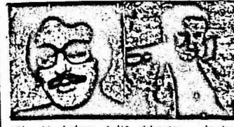
١١ معمومات عالمه ، وبواصل ندرساته القومية على الشعي سجاج ، واجريت له آخر علميه في ساقه السرى حيث جرى تنطقها تماما من بعض الشطابا التي كانت بها ، وقالوا بأنه سمود الى ارض الوطن في غضون الشهرين القادمين بعد ان يكون قد تمكن من

ليست في مصلحة اي من الطرفين ، بل انها تؤدي الى المزيد من الدمار وسفك الدماء واستنزاف موارد الجائنين " . وينسجم ندا الزعيم السوفيتي مع النداءات المتكررة التي اصدرتها مختلف المؤسسات والمنظمات الدولية بهذا الخصوص ، ومن بينها ندا مجلس الامن الدولي للظرفين العراقي واليراني بوجود وقف