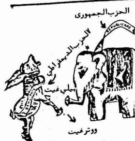
الحزب الجمهوري للخبز الديمقراطي ووترغيت

بمنازل منع الصيادين من اجراء مسيرة امام وزارة من طعن الصيادون اضرابا منذ اكثر من ستة اسابيع من الحكومة الداعية لتقليص عدد الصيادين من ٢٥ الى ١٠ مطالب المضربون ايضا بزيادة اجورهم وتخفيض