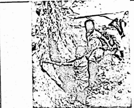
هذا الفنان يميل الى الاضداد بشكل خاص في النواك الفنية ، حيث لم يتركنا من سعاده الحسنة من حواف اربابنا هناك .

حزن خويبي يعدو نحو الاحراش والاوراق المصفرة تتنذى بيضاً (أهمي) كان هنا ، بين الرفاق المعذبين ، ولا تجده في الربيع فوح الفصول .. والنار في القلب ومن البساطة تحمل الامام ... اننا اقربا ، لحقيقة فكرنا .. ولا تجده في الربيع .