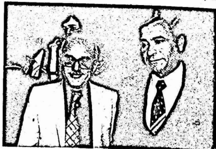
التي فرضت على الطلبة في رام الله، ومواجهة المظاهرات الطلابية في جنابها البقية ص ١١

تجرح برب عودة الهدوء الى الضفة الغربية كنتيجة لقرار الابعاد. وقد جاءت الاحداث اللاحقة في