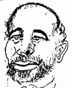
العراق في هذه الحرب حين وعد بان تكون خاتمة وبانها قد تمحيم سريعا بالخصميتي .