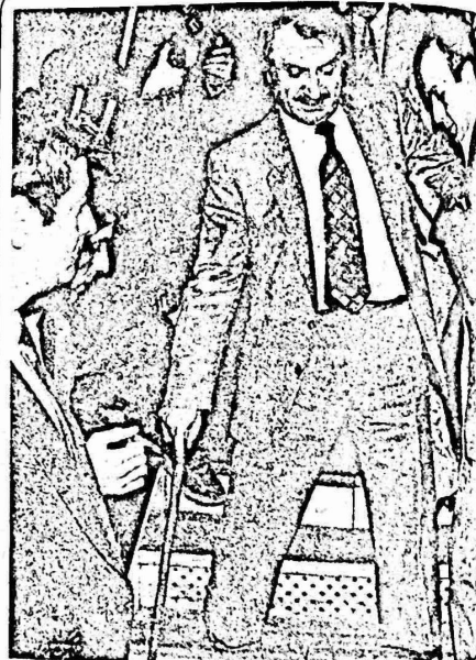
الثلاثة اثناء نزوله على سلم الطائرة التي اقلته من باريس للاشتراك في ندوة "القدس" التي نظمتها لبيروت لبيروت وهو بالسابقين للصيريين قبيل تركيب الاطراف الخادبة له بايام