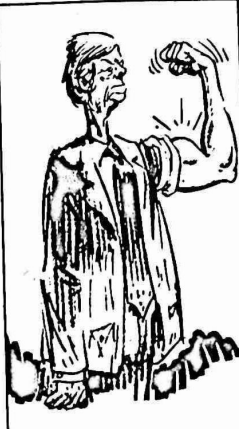
سياسة كارتر الشرق اوسطية

بدورهم عن " اهمية كارتر الاستراتيجية بالنسبة لمصر ولمفاوضات الحكم الذاتي ، وهذا ما