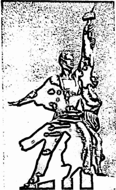
العامل والفلحة للحناة فيرا موشينا - من الفولاذ الذي لا يصدأ ١٩٢٧