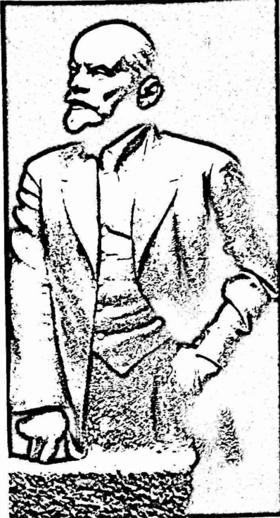
لينين - النحات اندرييف ١٩٢٢