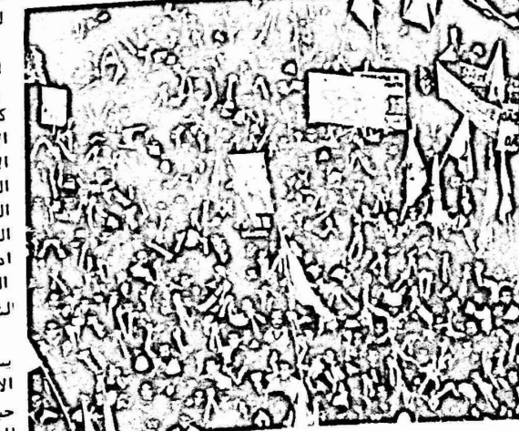
جماهير البرازيل تصرخ في وجه الديكتاتورية الفاشية لسن نمر ١ يتجاهد في العمود شعارات الحزب الشيوعي البرازيلي . .