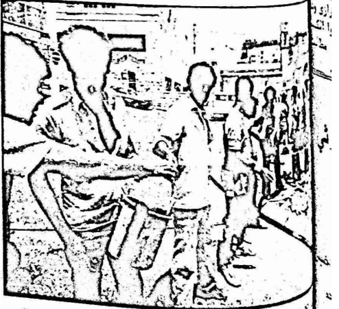
العمل التطوعي التاسع فى الناصرة

من الناصرة استعدادتانيا المكثفة لاستقبال المخيم التاسع التاسع الذى سىد فى ٨/١٥ ويتسبى فى ٨٤/٨/١٨ حيث سيعاين العديد من المشاريع التطويرية. قدمت البلدية جميع التحضير لمخيم العمل وانجابه. ساهم ريفانينا التمسدة كما ودعت الاف العاملين حيث شاركوا فى النشاطات والمهنيين والاختصاصيين الى