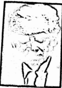
• البرقغالي •