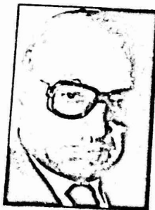
• من اليمين •