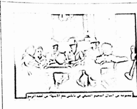
مجموعة من اطفال المحمبات الصغرى في يلمس مع الاحباء في تفته الرسم

في مدسة القدس اتمحت مدسة العفتس للعداوس احبابة يوم الازفة الخامس ٨٤/٧/٤ محمبات الصغرى الاول للاطفال والذي يعم ٣٢ طفلاً من سن ٨ - ١١ في مركز الازفة العلميتس بالقدس. حيث تستمر حتى ٨٤/٨/٨. ويستل المحمبات عدالات مختلفة منها الرياضة والاشغال والانسداد الوظيفية والساحة الوجزات الاستطلاعه وسلسلة خدمته.