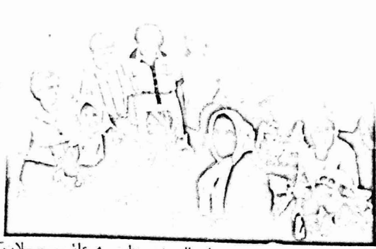
جانب من الاعتصام الذي نظمته عائلات المعتقلين من مقر الصليب الأحمر بنابلس

وجرحه السبلات والديارات من التعذيب . ووقع على السبلات كل من لجنة الترابز العامة الفلسطينية ، لجنة الترابز الفلسطينية ، ولجنة الترابز للعمل الإحصائيات . هذا وكان أهالي المعتقلين الإنس في سجن الدامون ، قد