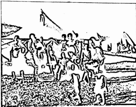
"تل ابير" المورة الاستيطانية التي نصبها المستوطنون قرب رام الله

الخيام في مورة استيطانية اسوها "تل ابير" قرب رام الله وذلك تمهيدا لتحويلها الى مستوطنة دائمة.