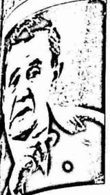
اندريه غروميكو - وزير الخارجية السوفيتي

عقد حزب العمال البريطاني مؤتمرا وافر برنامجا للحديد