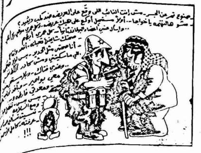
رجوع شرمين الجسر - استئناف العلاقات بين الأردن ومصر

وفي محاولتهم الساذجة للخلط بين شعب مصر ونظامها المعادي لهذا الشعب يتناسون عن عمد دروس التاريخ ودروس الحاضر . اثنا نعتز بشعب مصر الشقيق كما نحب الشعب الامريكي وان كنا نعارض نظامه ونقدر الشعب الفرنسي وانجازاته الحضارية وان كنا نختلف مع نظامه . وهكذا الحال مع شوب اخرى كثيرة . وفي الحاضر يمكن رؤية ان الدور الذي تلعبه الامم ودولها لا يتوقف عند حدود تعدادها وامكانياتها وطاقتها الكامنة والمعطة والا لما كان هناك مجال للمقارنة بين دوري اندونيسيا واليمن الديمقراطي او بين البرازيل والمكسيك وبين كوبا ونيكاراغوا ، وبين تركيا وسوريا ولتان حسي من وجهة نظرم كذبنا صارخا خووف امريكي من دور عرينادا والامتلة كثيرة جدا . في الماضي لم يكن دور مصر في الوطن العربي واحدا على مر العصور ، فلقد لعبت دورا متقدما ورائدا في بعض العهود ودورا هامشيا ونايبا في عهود اخرى