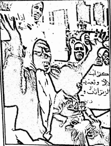
تظاهر في بيروت المرسة ، خلال الاسبوع الماضي ، العديد من امهات واسماء ونوى الكثيرين من احتجازوا واحقت اثارهم خلال ال ١١ سنة الماضية . وطلبت المطهرات بالكشف عن مخر نوبين والافراح معهم واغادهم خلال الى اطفالهم ، الى امهاتهم وروحهم واطفالهم . ويذكر ان المئات من المواطنين احقت اثارهم عند الغزو الانجليزي الى لبنان في حزيران ١٩٨٢ واحصاح القوات الانجليزية لسروياتهم ، ويعتقد مراقبون عدديون ان عماليات الانجليز المرسة مع اسرائيل احتضت الكثير منهم ولم يعرف مصيرهم حتى الان .