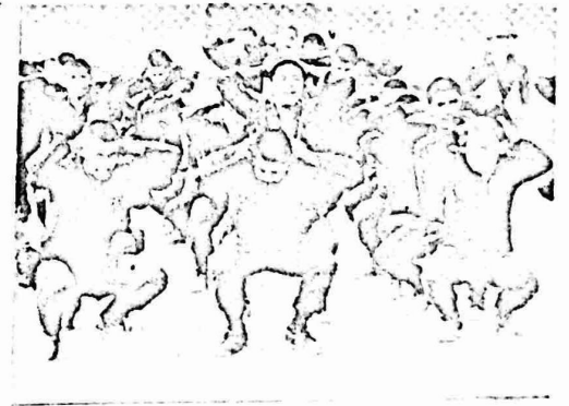
افراد من عصابات الكونتراس اثناء عملية تدريب في هندوراس .

عقبت مجلة "نيوزويك" على محاولات ادارة ريفان المحمومة لتقديم مساعدات عسكرية واقتصادية لعصابات "الكونتراس" المعادية للثورة الساندينية في نيكاراغوا . يطرح السؤال التالي "من هم الكونتراس" ؟ الذين يفهم ريفان "بالمقاتلين من اجل الحرية" ؟ كما تساءلت المجلة ايضا : "هل يحظى الكونتراس بدعم الشعب في نيكاراغوا؟"