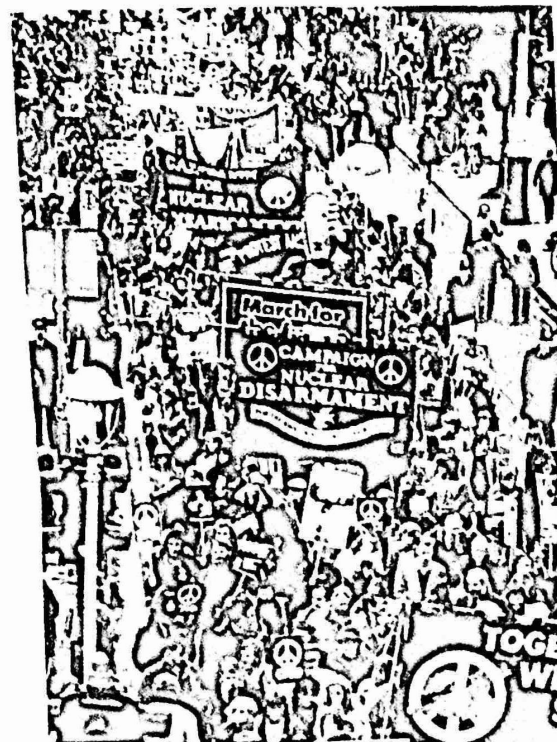
مظاهرات في بريطانيا ضد التسليح النووي (صورة من الارشف)

.. في القمرة الاخيرة حين وصل جنود ساق التسليح الى درجة كبيرة من الخطورة . يدخل احاسبا اساسي على قيد الحياة فقط معززة حقيعية . ولكن فما لو احدث الضوب بندا ، موسكو ودخلت العرون الواحدواالعشرون نقطعة من السلاح النووي فانها سنعفى من هذا الخطر الوجم . عن "اساء" موسكو