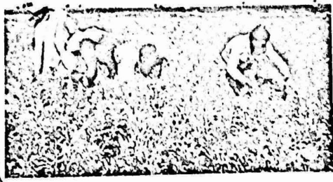
بجمع المصنوع بهمة وحماس، بصطدموسر بالعراقيل الاردنية

المزارعين المحليين في شال الصنفة من تسويق منتجاتهم في الاسواق الاسرائيلية، وتحرك هذه السلطات اجهزة رقابة وردع متعددة لتنفيذ سياسة المنع، وخصوصا تجاه المنتجات الزراعية الرئيسية كالحضيات والبندورة والباذنجان، والبصل وغيرها. اما السلطات الاردنية، فقد قامت، خلال الموسم الحالي، بتخفيض كمية الخضار المسموح لها