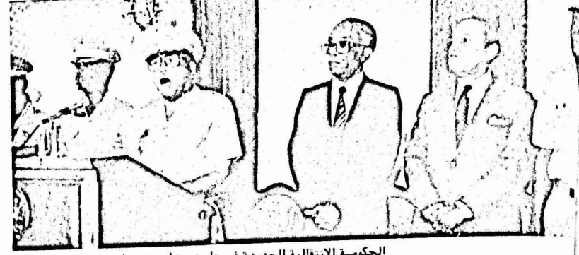
الحكومة الانتقالية الجديدة في هايتي تواجه تحديات صعبة ، من الجماهير الهابسة ، التي نزلت الى الشوارع وهي تطالب بتشكيل حكومة مدنية ديمقراطية وللإعتراف عن استنكارها لمقتل خمسة من المتظاهرين على أيدي رجال البوليس في الأسبوع الماضي .

في السابع عشر من شهر شباط الماضي ١٩٨٦ أحرزت الانتفاضة الشعبية في هايتي انتصارا اوليا وزلزلت نظام القمع والارهاب الذي بناه على رأسه الديكتاتور الصغير "جان كلود دوفالييه" . وتمكنت انتفاضة من أرغام سادة النظام الديكتاتوري في واشنطن على ترحيل ضاميه "دوفالييه" على متن طائرة عسكرية أمريكية الى منفاه "لوفت" في فرنسا. وإذا ما أخفت "واشنطن" رأسها ، أمام "كافة" الشعبية في هايتي ، فإن المراقبين يلاحظون انه "لوقت" مؤقت ، وهو جزء من تكتيك الاحتفاظ بالنظام السياسي الحالي ، بعد اجراء جراحة تجميلية له فقط ! وهذا يطرح سؤالاً ملحا : برأي نتجه هايتي ؟