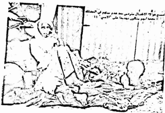
الدمار الذي لحق بالبيوت العربية بعد هدمها من قبل السلطات الإسرائيلية. في الخلفية، إحدى العائلات التي سكنت في المنطقة قبل الهدم.

سكانها دائما ، او السماح لهم ببناء بيوتهم في اراضيهم التي يظنونها ويعتاشون منها . كما طالب طوبى بالسماح لمزارعي الجفتلك الذين قدموا من قريتي طمون وطوباس وكذلك هدمت بيوت تعود لمزارعين يعيشون في المنطقة المذكورة منذ عام ١٩٤٨ حيث لجأوا اليها من الاحتلال ضدهم . ويشير الاهالي في منطقة "عجور" وقضاء الخليل وبئر السبع . ان معظم البيوت التي هدمت هي بيوت مزارعين من طمون وطوباس ، وقضاء (هذه البيوت) على ارض مسجلة باسم قرية قزوة الغوفا /عجور الفارعة ، منذ عام ١٩٢٧ . وكذلك هدمت بيوت تعود لمزارعين من المنطقة المذكورة منذ عام ١٩٤٨ حيث لجأوا اليها من الاحتلال ضدهم . ويشير الاهالي في منطقة "عجور" وقضاء الخليل وبئر السبع .