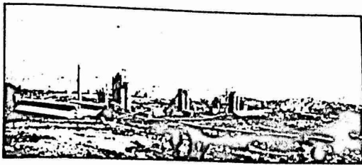
مصنع للاسمنت اقيم في اثيوبيا هذا العام بالمساعدة الكوبية للامانة الشرقية

اقام الاتحاد السوفيتي جسرا جوبا منذ اسامع لنقل المساعدات الغذائية والغنية الى اثيوبيا وذلك لمساعدتها في التغلب على المجاعة وذكر الانباء ان الجسر الجوي يتضمن عدة طائرات محملة بالاعذية اضافة الى شاحنات ومركبات وطاقمات هيلوكبتر لنقل هذه الاغذية الى المناطق المتكوبة بالمجاعة في اثيوبيا.