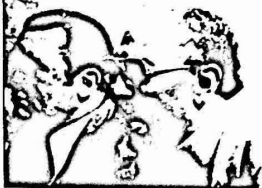
الانفتاح الاقتصادي ... السلف والخلف

وكانت واشنطن قد عقدت عدة اتفاقات مع مصر تشمل اعاده اسلحة الطائرة المغالطة (ف-٥) في مصر ، على ان يقوم الجانب المصري بانتاج نسبه ه بالمشه منها . ووافقت فرنسا على ان تقوم مصر بتصنيع طائره الميراج ، وصواريخ