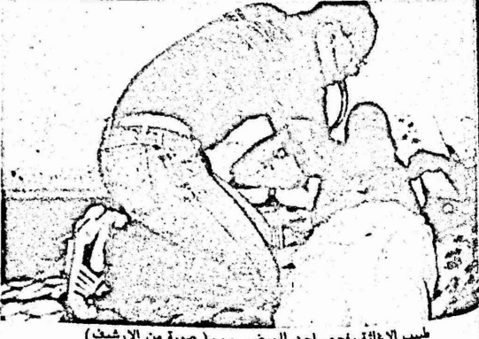
طبيب الاغاثة يلخص احد المرضى ... (صورة من الارشيف)

واصل اتحاد لجان الاغاثة الطبية الفلسطينية نشاطاته الدورية ، والتي امتدت خلال العام الحالي بتحسين متواصل في نوعية الخدمات المقدمة ، وشكلت حملات الاغاثة الطبية التي تشمل القرى والمخيمات في مختلف مناطق الضفة الغربية وقطاع غزة .