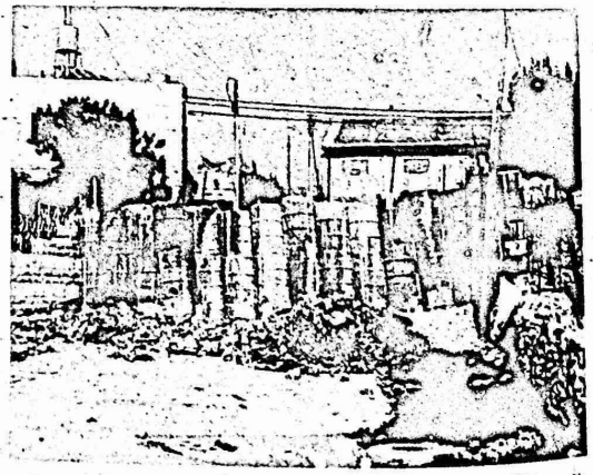
ينتصب هذا الحاجز على ثاني اهم مداخل مخيم الأمعري ويقع بجوار مدرسة الاناث ..

يتعرض اهالي مخيم الأمعري للاجئين الفلسطينيين، منذ فترة غير قصيرة، لممارسات استفزازية عديدة من قوات الاحتلال تتفل في الاعتقالات والدوريات الراجلة ، خاصة في ساعات الليل والحواجز والمراقبة المكثفة والاعتداء بالضرب وغير ذلك .