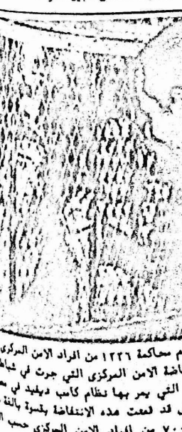
الذين اتهموا بالمشاركة في انتفاضة الامن المركزي التي جرت في شباط ١٩٧٠ والتي عبرت عن الازمة الخائفة التي يمر بها نظام كاسب ديفيد في مصر. الى قتل ١٠٧ وجرح حوالي ٧٠٠ من افراد الامن المركزي حسب الرسمية.