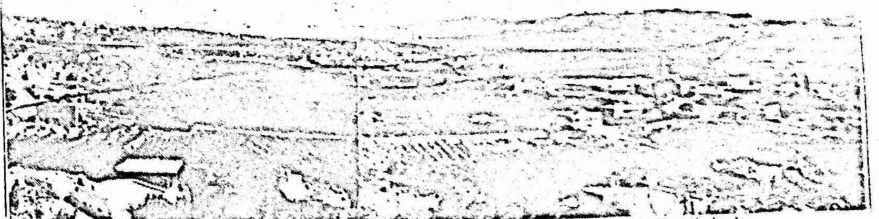
منظر عام لقرية الخضر، ويظهر رسم تقريبي لمخطط الشارع الذي يقسمها من منتصفها، ويتلف مئات الدونمات الزراعية

ويعد ان اخذت اعتراضات الاهالي جرحا، فوجئوا بالسلطات تطلب في نيسان من العام الجاري، من كل معترض، ان يرفق اعتراضه بخارطة مساحة تبين الاحواض والقطع التي يملكها مع وضع الشارع المقترح عليها ومن الديهي ان اعداد مثل هذه الخرائط يكلف المعارضين مبالغ باهظة، فاستعاض عنها بخارطة اجمالية تقدم بها المجلس القروي.