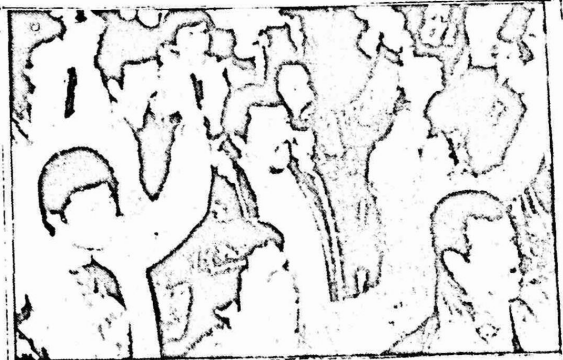
لم يعد العمال الشيليين يخافون شيئا وتعلموا استخدام كافة اشكال التضال للتعبير عن مطالبهم ، كما يتبين من هذه الصورة التي التقطت اثناء اضراب نظمته عمال مناجم النحاس في التينيتي

تحالف قوى اليسار : الحركة الديمقراطية الشعبية . ومن معالم انعزال الديكتاتورية بشكل متزايد ان اصحاب سيارات النقل الذين ساهموا في زعزعة حكومة الوحدة الشعبية برئاسة سلفادور آلندي قاموا باضرابات ونظمو احتجاجات عند الديكتاتورية التي تدفعهم سياستها الى الافلاس . ويواجه صغار التجار ومتوسطيهم ايضا اوضاعا مشابهة ويدفعهم وضعهم المتردى الى الانضمام باعداد متزايدة الى الحركة الشعبية . المطالبة باجراء تغييرات عميقة .