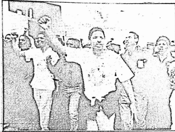
عمال المناجم في احدى مظاهرات التأييد لقادتهم

وهكذا انزلت شعارات الاضراب التي اعتلت مداخل المناجم، وتوقف العمال عن انشاد النشيد العالمي "كل الالات تتوقف اذا شاءت يدك القويتان". فيما ترتفع في سماء جنوب افريقيا كلمات النشيد العالمي الوطني الذي كتبه الشاعر "بنجامين مولويز" ومطلعه يقول "المجد للشعب المقاتل" وقبل صعوده الى جبل المشنقة.