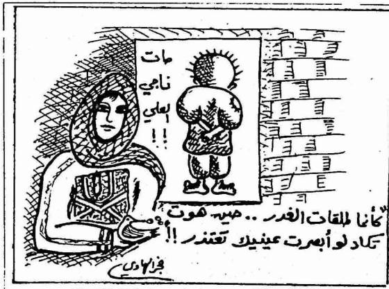
هذا وقد اثار رحيل ناجي العلي ، المستوى العربي والدولي . وتصدر نأ حملة غضب واستنكار عارمين على الوفاة الصفحات الاولى في كثير من

بعد ٢٨ يوما من الصراع مع الموت ، توفي الفنان الكاريكاتير الفلسطيني الشهير ناجي العلي (٥٠ عاما) ، فجر السبت الماضي ، متأثرا بجراحه اثر محاولة اغتيال اجرامية تعرض لها في الثاني والعشرين من تموز الماضي على يد مسلح "مجهول" اثناء خروجه من مكاتب صحيفة "القيس" الكويتية في لندن . وقد اعلن نأ وفاة العلي متحدث رسمي باسم "القيس" . ثم اصدرت ادارة مستشفى "شيرينغ كروس" بيانا رسميا اكدت فيه نأ الوفاة . وذكر البيان ان العلي توفي نتيجة هبوط في دقات القلب .